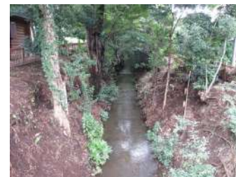
玉川上水桜橋より下流を臨む 自然状態の河岸

武蔵野市の航空写真を見ると、西の小金井公園と東の井の頭恩賜公園をつなぐ緑のライン、これが玉川上水です。そして、境橋あたりから分かれて、五日市街道沿いに緑の影を落として西東京市との間を流れているのが千川上水です。歴史的に見ると、約360年前に江戸市中に水を送るために掘られたこれらの上水ですが、水の乏しかったこの地域の農業生産が盛んになりました。水の流れと木々の緑、よく見るといろいろな昆虫も見られます。自然を楽しみ歴史に思いをはせることのできるこの二つの上水沿い、一度散歩してみませんか。