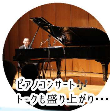
ピアノコンサート♪ トークも盛り上がり...