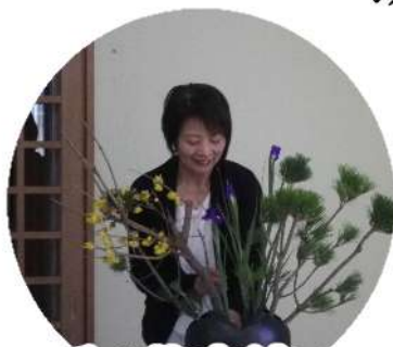
活け花実演 活け込みの早技にビックリ！