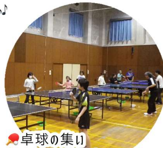
卓球の集い またまた大盛況でした！